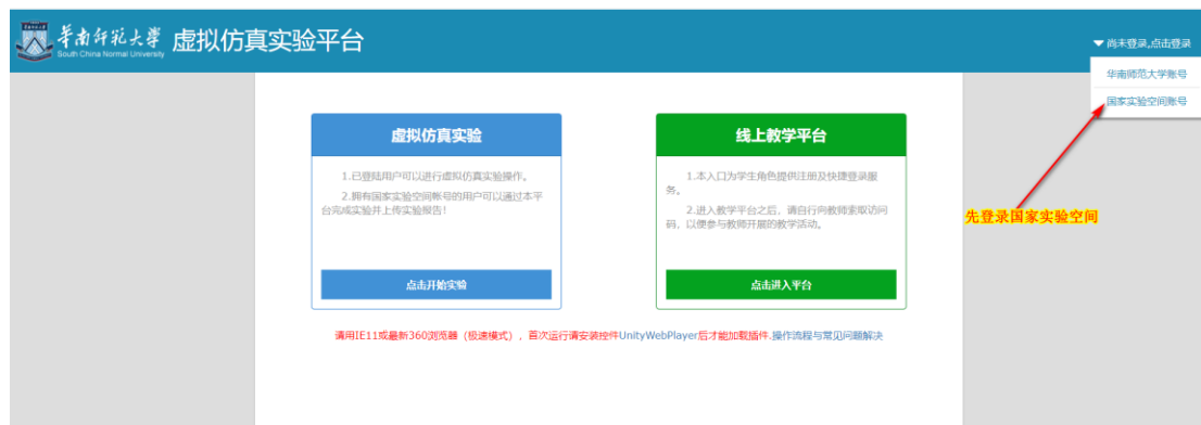
图 1 华南师范大学虚拟仿真实验平台

http://www.ilab-x.com/details?id=174 见到图 2