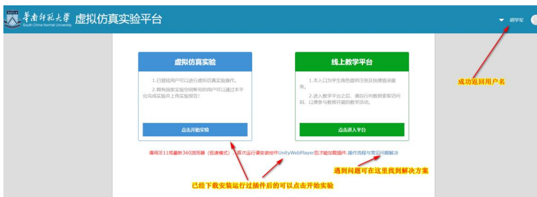
图 4 成功登录虚拟仿真实验平台

成功登录后就可以点击开始做实验，注意首次或遇到加载失败，需要运行下载安装插件，下载地址在 http://vrlife.scnu.edu.cn/exp/UnityWebPlayer.exe 更多帮助和问题解答地址： vrlife.scnu.edu.cn/help/index.html