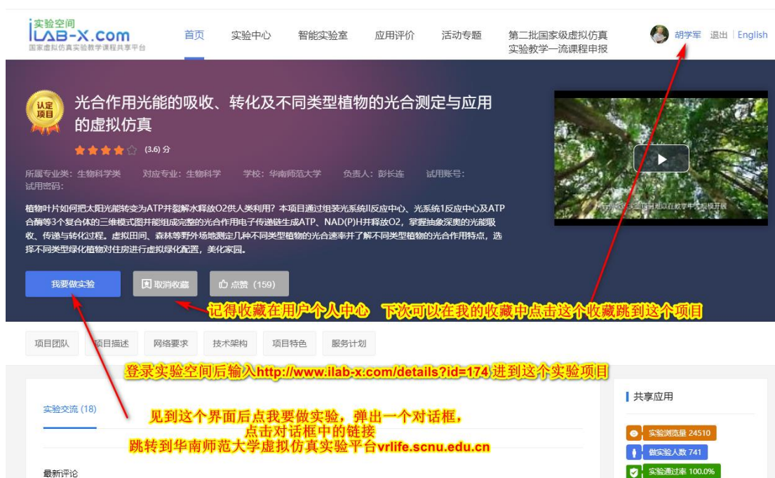
图 2 光合作用实验项目的实验空间登录界面